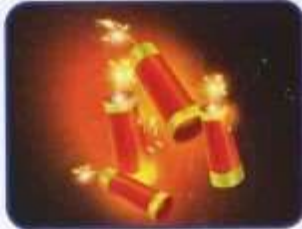
Необережна поведінка з піротехнікою