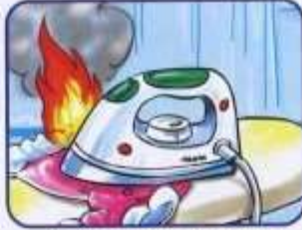
Залишені без нагляду ввімкнені електроприлади