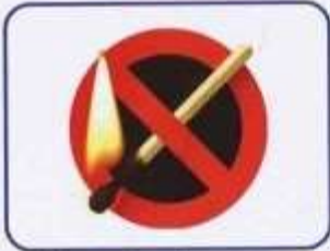
Пустощі з сірниками