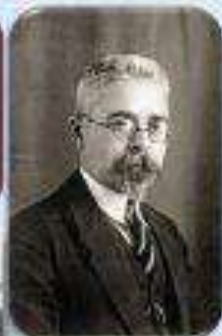
Іван Огієнко – ректор університету