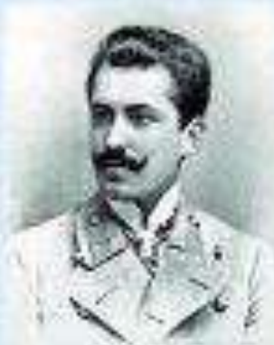
Дмитро Дорошенко – історик гетьманської доби, який писав: "Весь край укрався сіттю українських книгарень."

Софія Русова. Видавництво «Українська школа» в серії «Українська педагогічна бібліотека» видало її працю «Нова школа»