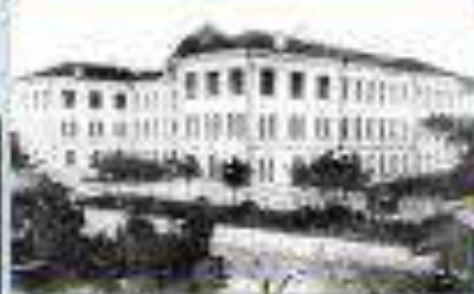
Кам'янець-Подільський державний педагогічний університет

Політика гетьмана П.Скоропадського в галузі освіти