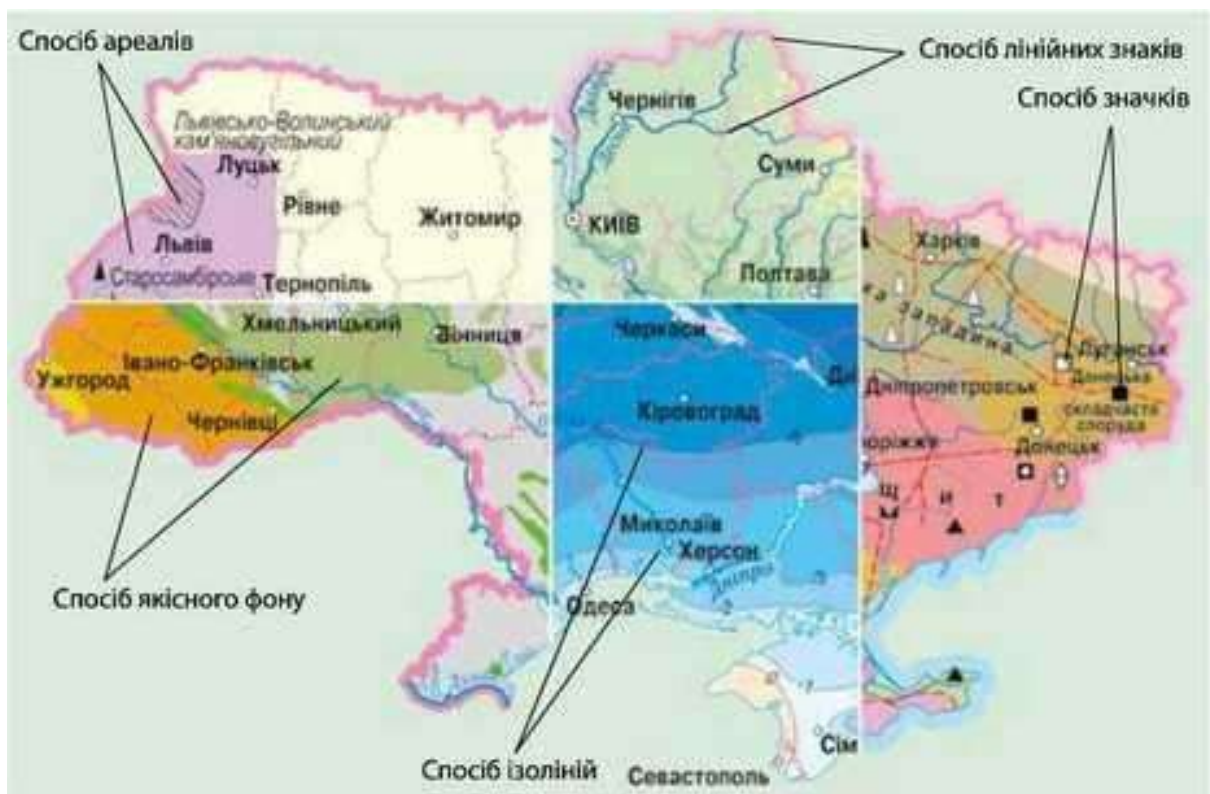
Мал. 15. Способи картографічного зображення на картах