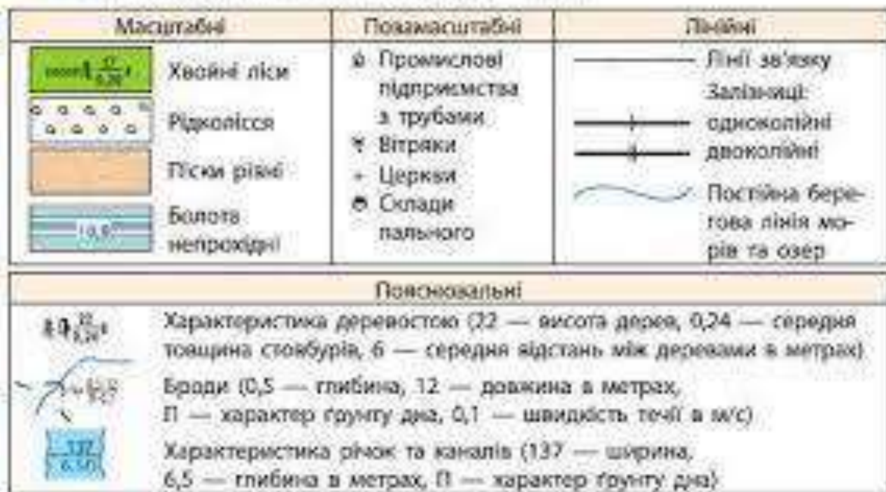
Рис. 1. Приклади умовних знаків топографічних карт

1:200 000 до 1:5 000 (більші – це плани місцевості). Їх використовують для наукових досліджень, проектування міст, шляхів, морських портів, для розмежовування земельних ділянок, планування і проведення військових операцій, змагань зі спортивного орієнтування, у краєзнавчій і туристичній діяльності.