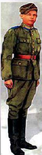
Тарас Бульба – Боревець організатор УПА