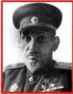
Сидір Ковпак командир партизанського з'єднання