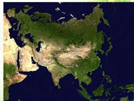
Євразія. Фото зі супутника