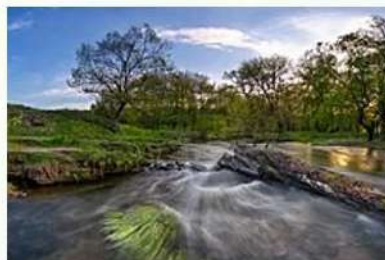
Річка Дніпро Регіональний ландшафтний парк Зуйвський