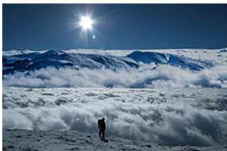
На Говерлі. Карпатський національний природний парк