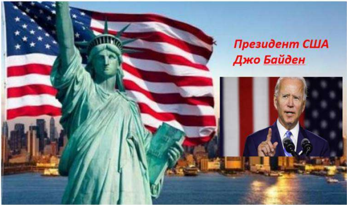
Президент США Джо Байден