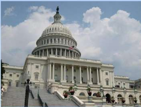
Капітолій – будинок конгресу, вищого законодавчого органу країни

У Вашингтоні містяться резиденція президента США (Білий дім), Конгрес, Верховний суд, Державний департамент, Міністерство оборони (Пентагон) та інші державні установи.