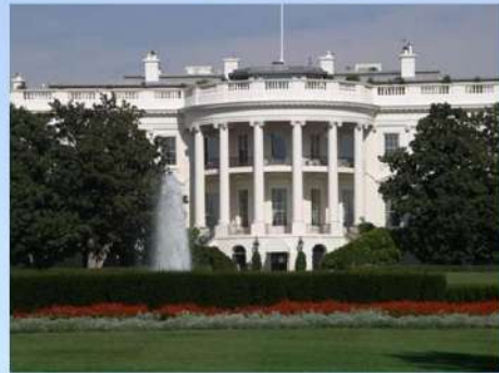
Білий Дім - резиденція президента США у Вашингтоні