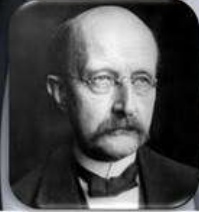
М.Планк (1918 р.)