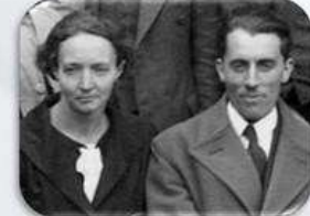
І. й Ф. Жоліо-Кюрі (1935 р.)