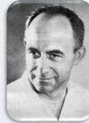
Енріко Фермі (1938 р.)