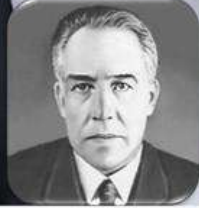
Нільс Бор (1922 р.)