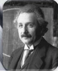
Альберт Ейнштейн (1921 р.)