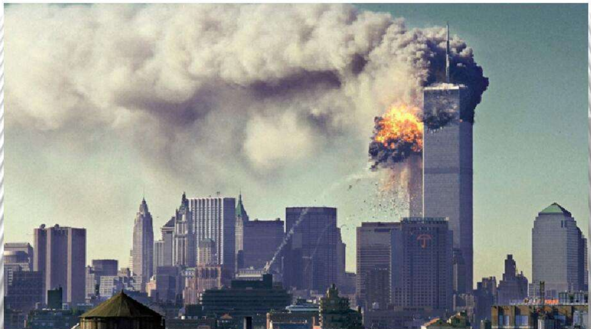
Теракт 11.09.2001 р. у США