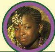
Представник негроїдної раси