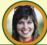
Представник європеїдної раси