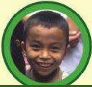
Представник монголоїдної раси