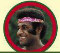
Представник австралоїдної раси