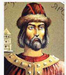
Ярослав Мудрий ( 1019 - 1054 рр. )