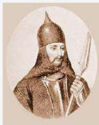
князь Олег ( 882 - 912 рр. )