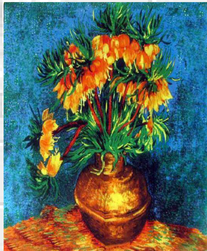
Квіти в мідній вазі