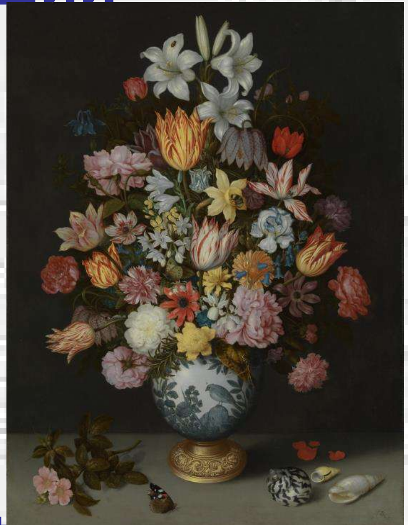
Букет в арочному вікні Натюрморт з квітами