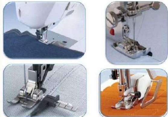
лапка - направлювач