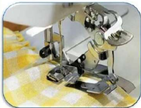
лапка для утворення збірок на тканині