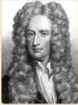
Ісаак Ньютон (1643–1727)

Видатний англійський фізик, астроном, математик. Сформулював основні закони механіки, закон всесвітнього тяжіння. Незалежно від Лейбніца започаткував математичний аналіз.