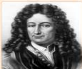
Готфрід Вільгельм Лейбніц (1646–1716)

Видатний німецький математик, фізик, філософ, організатор наукових установ. Разом з Ньютоном поділяє славу відкриття диференціального та інтегрального числень. Увів багато загальноновживаних тепер математичних алгоритмів, термінів і символів.