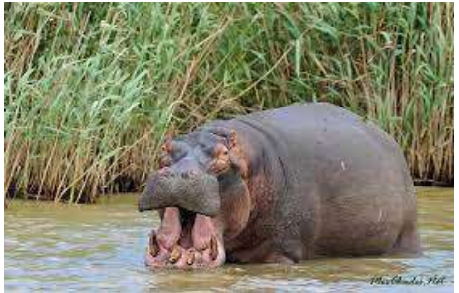
Hippopotamus [гіпотамес] Гіпопотам