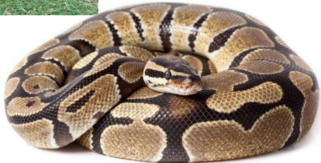
Python [пайсон] Пітон