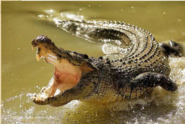
Crocodile [крокедаїл] Крокодил