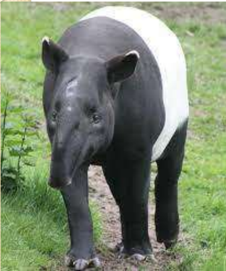
Тарі [тейпі] Тапір