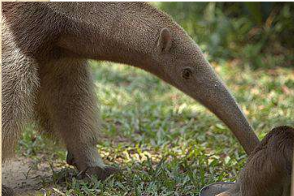
← Ant-eater [ен-іте] Мурахоїд