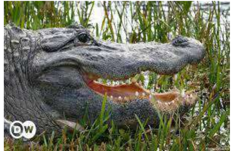
alligator [алігейте] Алігатор