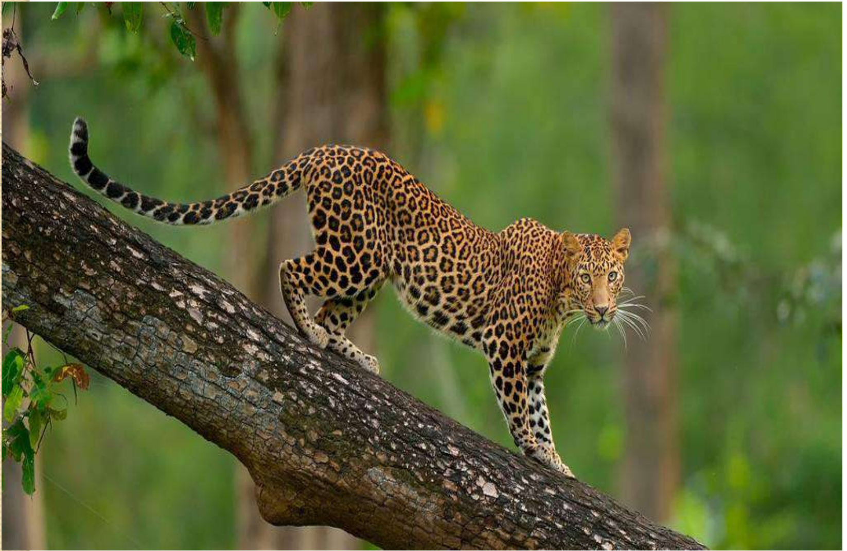
Leopard [лепад] Леопард