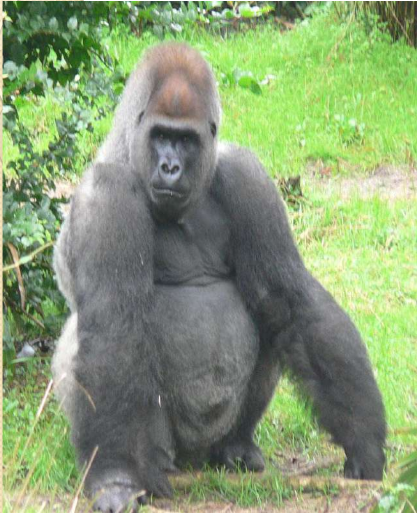
Gorilla [геріла] Горила