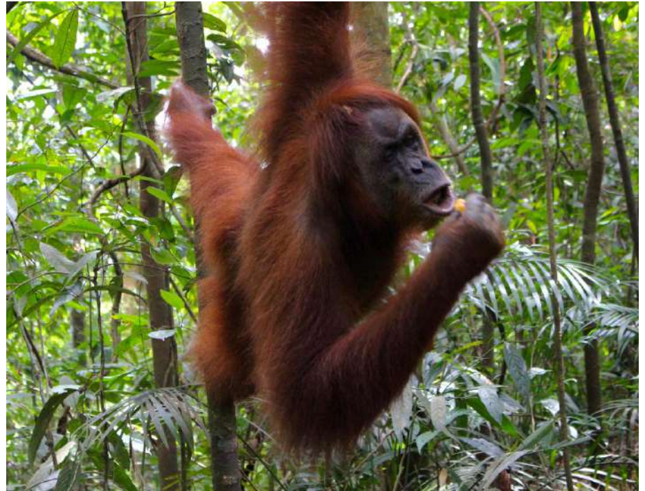
Orangutan [оренітен] Орангутан