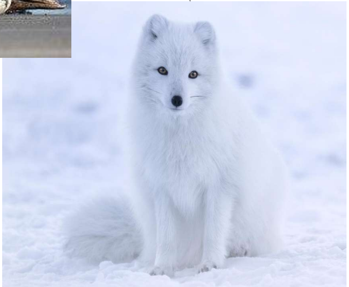
Ice fox [айс фокс ] песець