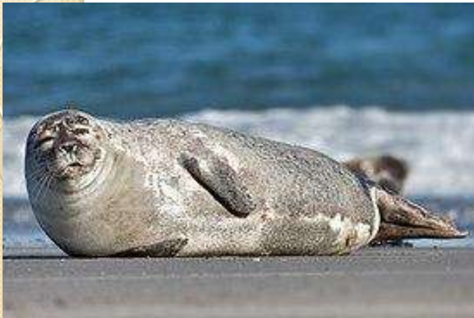
Seal [сі:л] ТЮЛЕНЬ