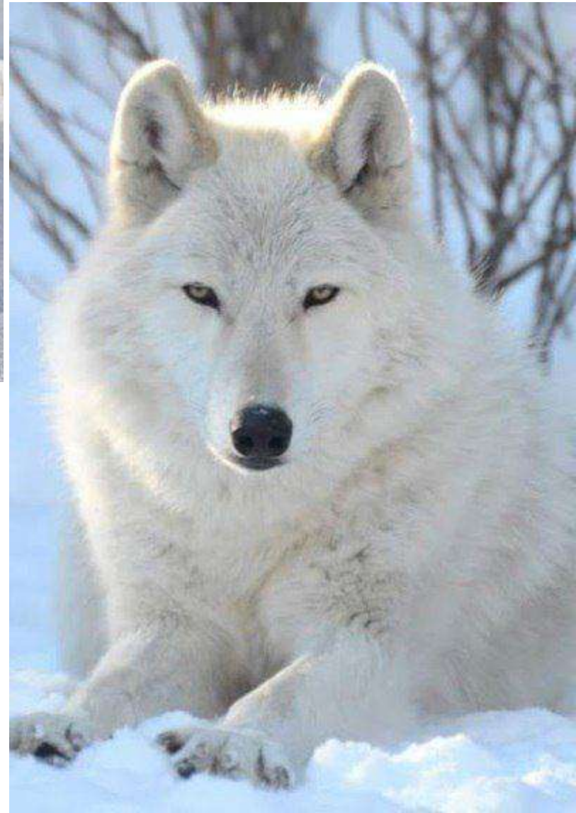
Polar wolf [поле вулф] полярний вовк