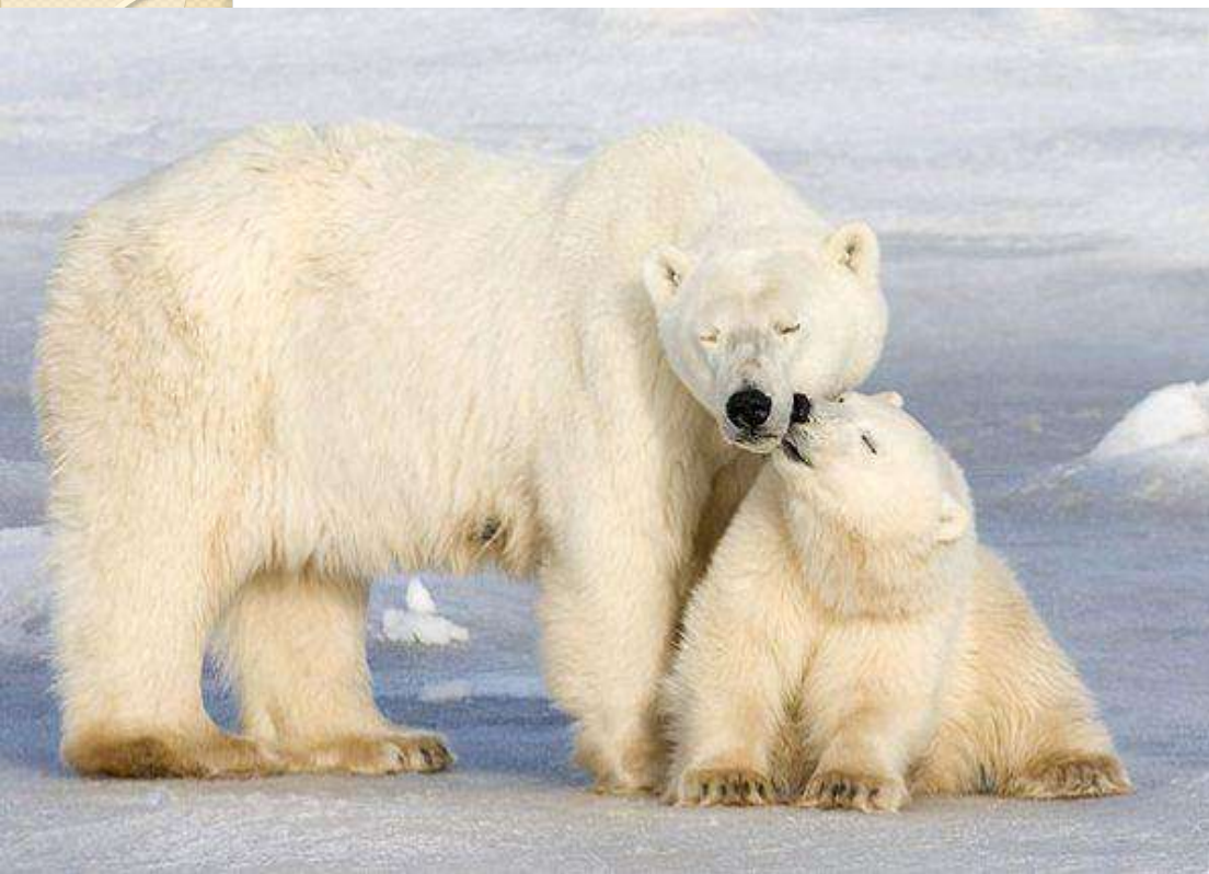
Polar bear [поле беа] білий ведмідь