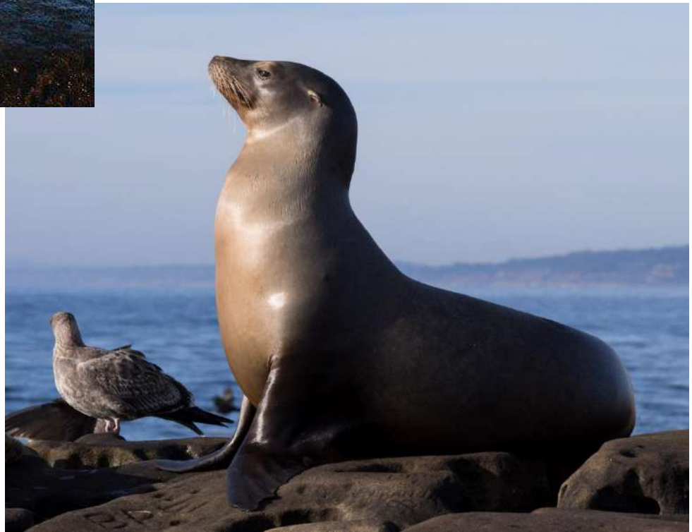
Sea lion [сі: лаен] морський лев