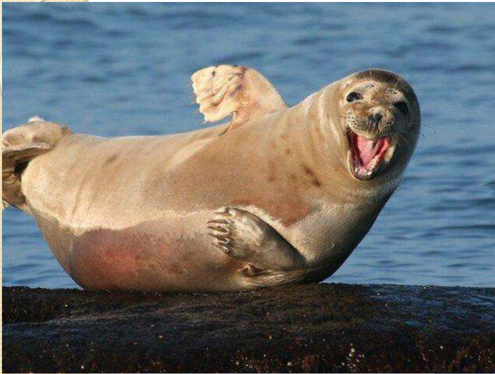
Fur seal [фьо сі:л] морський котик