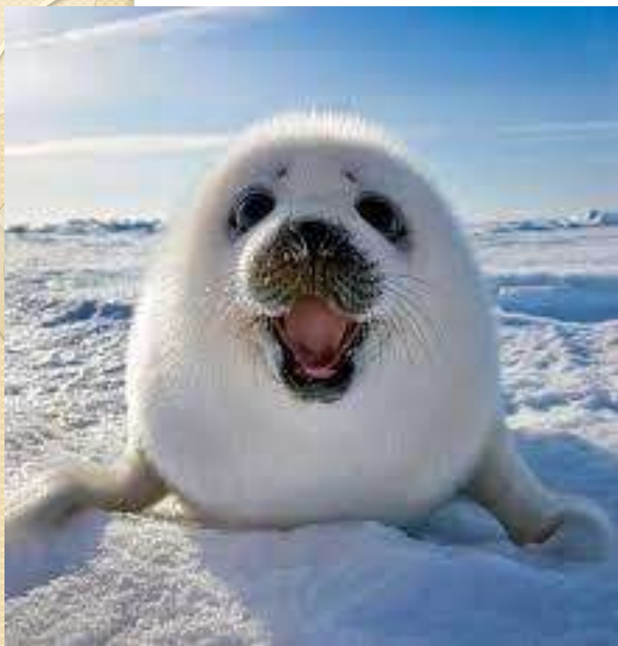
Seal [сі:л] нерпа