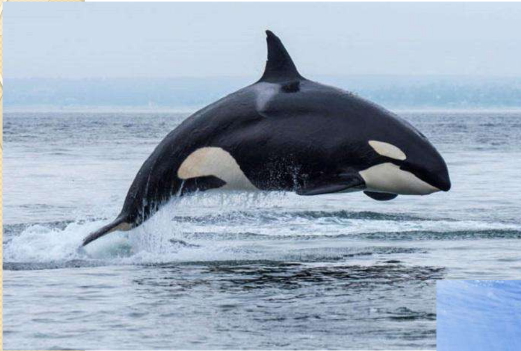
Killer whale [кіле вейл] косатка