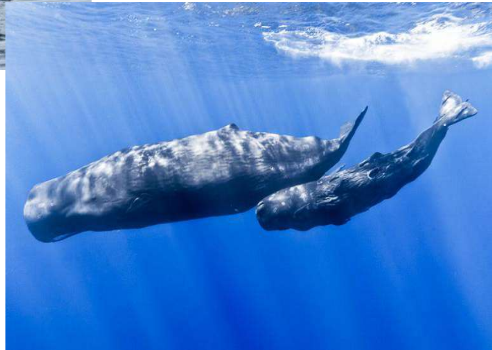
Sperm whale [спе:м вейл] кашалот