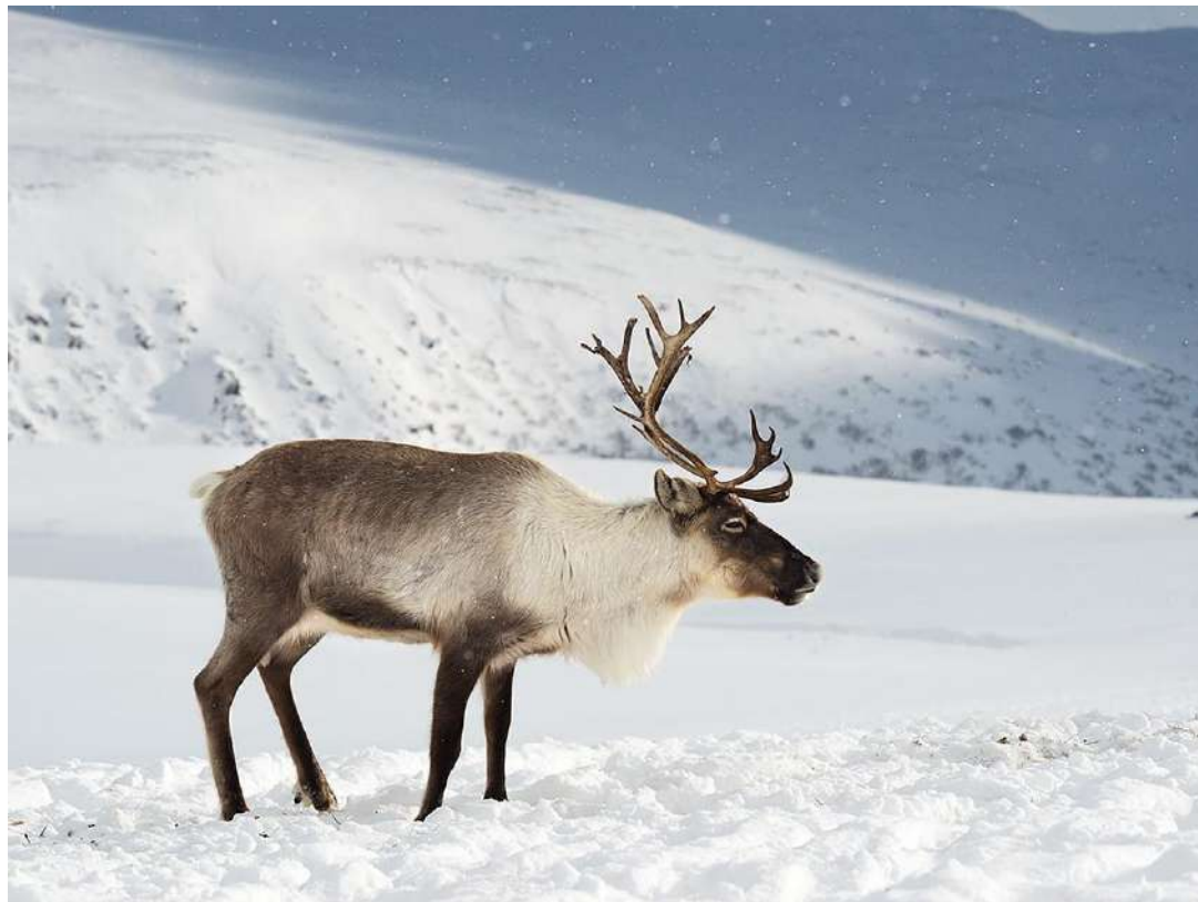
Reindeer [реіндір] олень північний