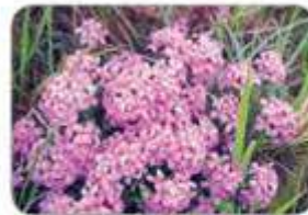
Вовчі ягоди пахучі

Розглянь зображення рідкісних тварин Українського Полісся (с. 92). Розподіли їх на групи: звірі, птахи, комахи.